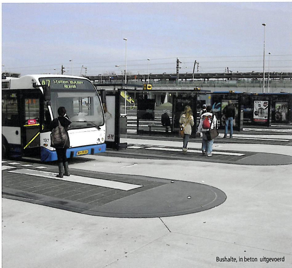
Bushalte, in beton uitgevoerd