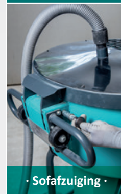
• Stofafzuiging •