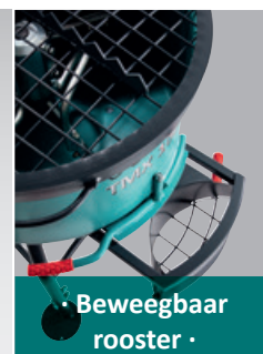
• Bewegbaar rooster •